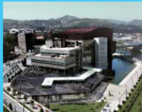
Euskalduna Jauregiaren 10. urteak "arrakastatsuak" izan dira

Euskalduna Jauregiaren 10. urteurrena Aurretan ospatzen du Bizkaiko Euskalduna Jauregiak bere 10. urteurrena. Euskalduna Jauregiako arduradunek "bikaina" bezala definitu dute lehenengo hamar urte hauetako ibilbidea. Aro oparo honen zehar Jauregiak bi sari jaso ditu, AIPC elkarteko Munduko Kongresu Zentro Onenen Saria eta Espainiar estatuko Kongresu Antolatzaileen Federakuntzako Sari Nazionala, 2003an biak. Urte hauetako zifrak Euskaldunaren arrakasta azpimarratzera datozte. Horrela, Jauregiaren batez besteko betetzea %88,1ekoa izan da, 2008koa errekorrekoa izanda, %94a, alegia. Datorren ekitaldirako ekintzen beherakada aurreikusten badute ere, hamarkada honetan 7,49 milioi euroko superabita utzi du Euskaldunak eta Euskadiko BPGren gaineko eragina 612.694.000 eurokoa izan da.