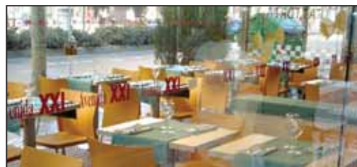
Farfalle jatetxeko terraza