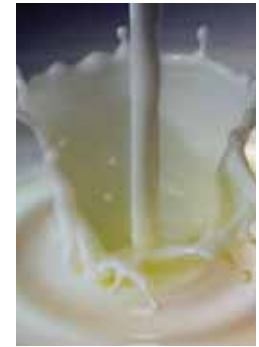
Nafarroako esnea urtebetez aztertu dute

kaltegarria kontzentrazio-maila seguruen barnean dago, egindako ikerketek erakutsi dutenez. AFM1 substantzia animaliek AFB1