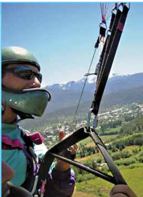
Bono honekin parapenteko hegaldiak egin ditzazkezu

NOLA ERABILI: behin bonoa erosituta, kaxaren barneko dokumentazioak esperientzia desberdinak izateko jarduerak eskaintzen dizkizu. Behin, guztien artean bata erabakita erabakita, bertako telefonora deitu eta erreserba egin. Aukeraturako zerbitzua erabiltzerako momentuan, paperezko bonoa eman behar da.