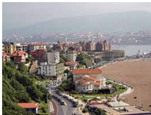
Getxoko komertzio eta turismoarako aukera "paregabeak" eskaintzen ditu