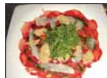
Carpaccio jatetxearen espezialitate bat omen da