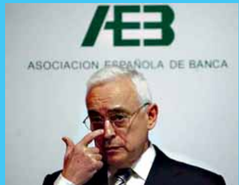
Espainiar estatuko Bankuen Elkarte (AEB) ez da enpresei eta familiei likidezia erraztearen alde agertzen

Madrilgo Gobernu zentrala eta Espainiar estatuko Bankuen Elkartearen arteko hika-mika areagotu egin da azken asteetan. Zapateroko Gobernuak maileguren iturria ez ixtea eskatu die banketxe espainiarrei, familia eta enpresek kredituen premia handia baitute orain. Bestalde, kaudimenaren baldintzapean soilik luzatuko dutela dirua adierazi du Espainiar estatuko Bankuen Elkarteak (AEB). Gobernuak utzitako dirua Espainiar banketxeek haren gordailuak babesteko erabiltzen ari dutela ematen du eta ez ekonomia berpizteko. Egungo krisialdiaren jatorria finantza sistemak berak eragin duenez, laguntzarik handiena orain arte gehien aberastu direnetik etorri behar da orain.