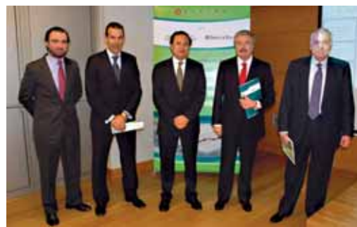
Zuzendaritzaren Aurrerakuntzarako Elkarteak (APD) jardunaldietako hizlariekin

ren baldintzetara egokitzeko asmoz. Enpresako sail guztietan eragina duen murrizketa-politikak aplikatzen ari direla adierazi dute erantzun dutenen %43k. Horrela, bada, gastuak egonkortzeko politika hauen arrazoiaren artean, nazioarteko enpresabu-