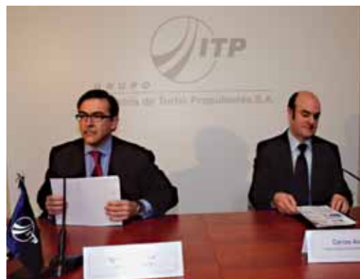
Lan kontratu honek 250 milioi euroko inbertsioa suposatuko du

Lehenengo motorra 2010ean izango dute prest, eta hortik urtebetera izango da turbina berrien lehenengo hegaldi erreala. Aurten hasiko dira inbentarioak turbinen diseinuetan, eta, hemendik bi urtera, lehenengo prototipoak aurkeztuko dituzte. Ekoizpen aurreko lehenengo fasean 200 lagunek hartuko dute parte. Hegazkinetako motoren soinu-aztarna murriztea ahalbidetuko du turbina berriak, bai eta errengarriaren kontsumoa murriz-