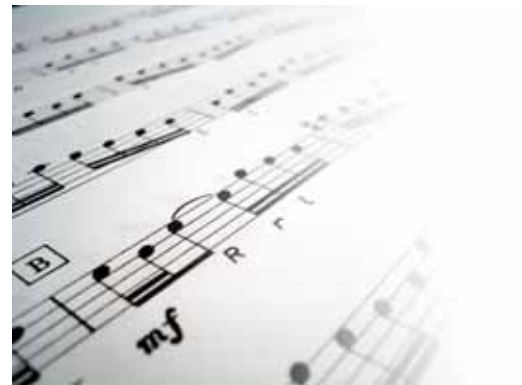
Musika atonalaren zaitasunak aztertu nahi ditu ikerketa horiek

Goi-mailako kontserbatorioetan musika atonalari buruzko azterlana sustatzea litzateke ikerlan honen xedea, Nafarroako Unibertsitate Publikoko Musika Saileko arduradunen aburuz; "musika ato-