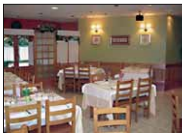
Kaialde jatetxearen jantokia