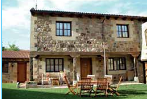
Baserri-etxe kanpoaldea, harrizko fatxadarekin

Casa La Panera 34829 - Cillamayor (Palencia) / Telf 979 12 27 54 - 646 11 16 35 / lanpanera@hotmail.com / www.casalapanera.com