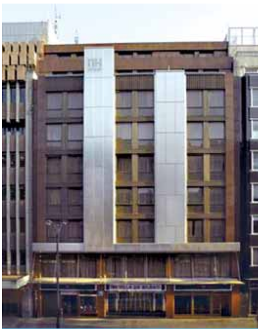
Bilbo hiriguneko NH Hotela

Bestalde, urte honetarako egiten diren iragarpenak ez dira batere onak turismoarentzat, 2009an %3ko jaitziera kalkulatu da BPGn. Ekonomia arloan, orokorrean, Gobernuak iragartzen du %1,6ko beherakada 2009-rako. Beraz, turismoaren arloa bikoitza gutxituko da.