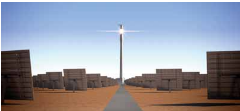
Gemasolar izeneko eguzki-planta

“India eta Txinaren sarrera lehenengo munduan beharrezkoa da”