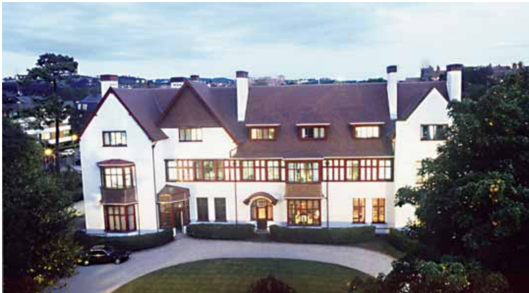
SENER enpresak Getxon duen egoitza

SENER Elkarteak Hego Amerika eta Europako