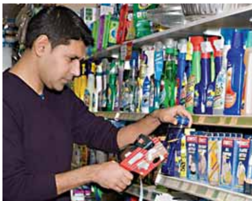
Dendari batek prezioak ipintzen