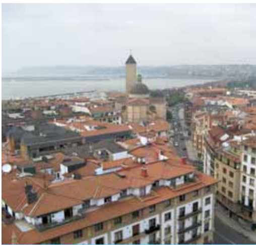
Getxo da lan-kapital sendoena duen Euskadiko hiria

kuntza Ekonomikoen inguruko Valentziako Institutua) egin zuten joan den urtean, eta badirudi emaitzak ez direla asko aldatu krisialdiaren hedapenaren ostean. Datuak, batez ere, ikasketa unibertsarioak dituzten herritarren por-