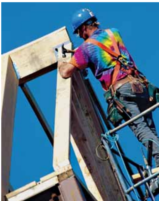
Eraikuntza eta industria sektoreak ahul jarraitzen dute

Txostenak dioten bezala, "eraikuntza oraindik ez da sendotu eta oraindik denbora falta zaio guztiz doitzeko". Aurtengo bigarren hiruhilekoan sektore honen jarduera %0,6 jaitsi egin zen, aurrekoan baino zortzi hamarren gutxiago.