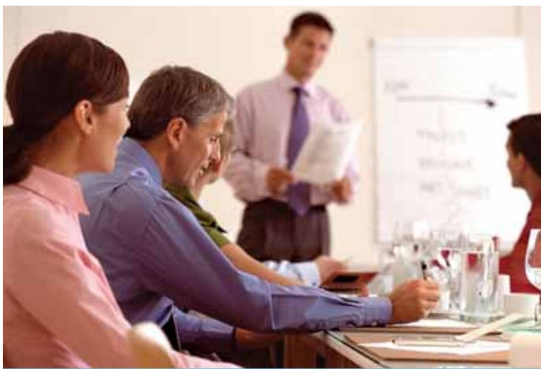
Langileen hezkuntza ezinbestekoa da enpresa batek aurrera egiteko

Gasteiz eta Irun, Estatuko lan-kapitalaren tasaren ginetik