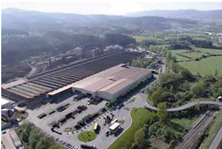
Tubos Reunidos taldeko Amurrioko lantegia

Taldeak inposatu nahi duen bigarren erregulazioa 767 langilerentzat ezarri nahi du. Eskaera onartua izatekotan, hamahiru hilabeteko iraupena izango luke (aurtengo abenduaren 1etik 2010. urteko abenduaren 31ra arte), eta gehienez beharginen lanaldiaren %75 kenduko litzateke, beste ezagurri batzuen artean.