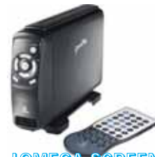
IOMEGA SCREEN PLAY BASIC

1,5 TB HDMI KONEXIOA BATERAGARRIA FORMATU ANITZEKIN