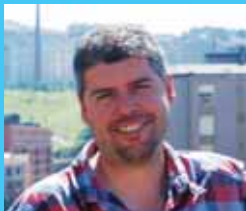
Unai Sordo CCOOko idazkari nagusia

“Zalantzarik gabe, ziurgabetasunezko egoera bizi dugu”