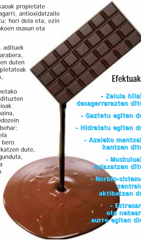
Kakaoa ez da guztiz bero egon behar

Lasaigarria da eta, adituek esaten dutenaren arabera, umore ona sustatzen duten bitaminak edo propietateak ditu. Hori dela eta, gero eta jende gehiagok mota honetako masajeak ematen dituzten zentro edo gimnasioak bilatzen ditu. Alabaina, txokolatea ez da edozein modutan aplikatu behar; profesionalak honela egiten dute: zorro bero batzuen bidez aplikatzen dute, masaje batekin lagunduta, baina kakaoa ez da guztiz bero egoten. Dena den, hoberena zentro espezializatu batera jotzea izango litzateke, ziur erosoagoa izango dela.