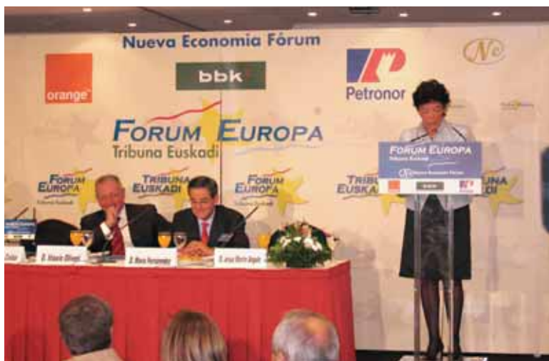
Sailburuaren helburua ikerkuntza sustatzea da

Bere hitzaldian zehar gehien errepikatu ziren hitzak "ikerkuntza" eta "berrikun-