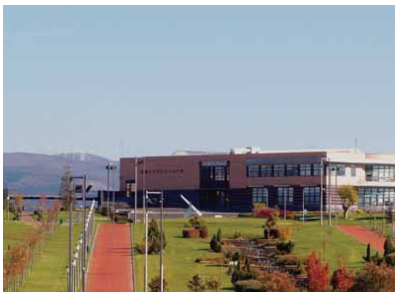
Arabako Parke Teknologikoko ikuspegi orokorra

Bizkaiko Parke Teknologikoa 1985. urtean jaio zen. Zamudion kokatuta, Euskal Herriko erakunde publikoen babespean, industriaren dibertsifikazioa, berrikuntza eta teknologiaren hedapena ditu helburu nagusiztat. Bertan, honako zerbitzu mota desberdin hauek aurki ditzakegu: telekomunikazioak, I+G-ko proiektuetarako bultzada, enpresen arteko kooperazioa, hezkuntza, en-