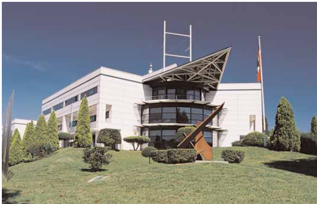
Bizkaiko Parke Teknologikoko Eraikin nagusia

Parke Teknologikoa ho-nako elementu hauen bilkura da: I+G proiektuak aurrera ateratzen dituzten enpresen bilketa, Unibertsitateekiko harreman estua eta inguruekiko errespetuz,