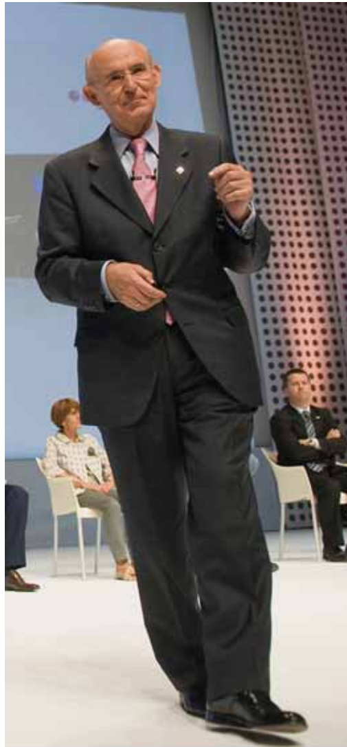
Uriarte pasa den ekaineko Berrikuntza Prozesuan

resgarri batzuk atera behar ditugu. Adibidez, estrategia komunak eta ongi partekatutako ezinbestekoak direla gogoratu behar dugu. Ekimen