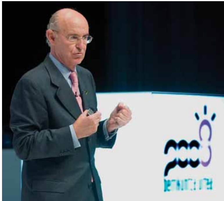
INNOBASQUE-ko zuzendaria mintzaldiaren momentu batean

Dirudienez, inkestek hala diote, behintzat, euskal gazte askok funtzionarioak izan nahi dute eta ez dute bere burua ekintzaile gisa ikusten. Zer deritzozu honi?