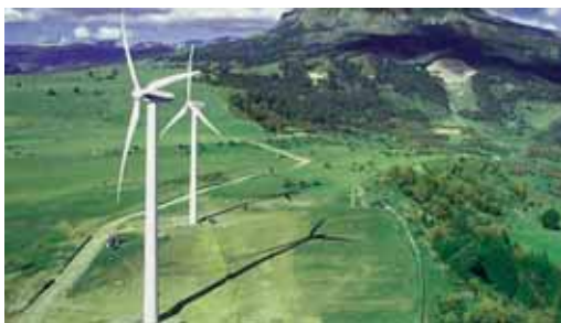
Energia berriztagarriak sustatuko ditu Iraunkortasunerako Institutuak

Bizkaia 21 Egitarauaren helburuak betetzeko asmoz, Foru Aldundiak martxan jarri