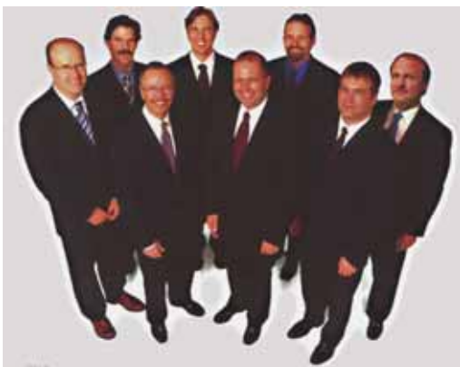
Krisialdi garaietan langile talde sendoa izatea funtsezkoa da

"Bigarren aholkua kudeaketa neurtzeko denbora-irizpidea aldatzea izango litzateke. Bizi garen garai honetan, emaitzak oso epe laburretan neurtzen dira. Batzuetan, ia astero. Nire ustez, enpresaren egoera eta zuzendariek egiten duten kudeaketa epe luzeagoetan aztertu behar dira. Oso zaila da erabaki estrategikoak hartzea, behin-behineko emaitza txarrak sorrarazten badituzte, merkatuak presio handia ezartzen duelako. Estrategia ez litzateke epe laburreko emaitzen arabera finkatu behar".