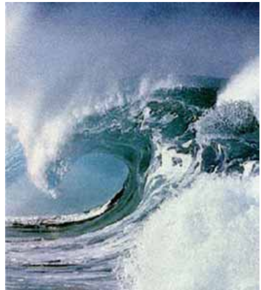
Iberdrolak eta Tecnaliak energia berritzailearen aldeko apustua egiten dute

Nanoteknologia medikuntzan ikertzeke dagoen zientzia berria dugu. Minbiziaren aurkako borrokan, nanoteknologiak medikamentuen alorrean badu zer esanik. Nanopartikulek minbizia duten gaixoen tumoreko zelulei zuzenean eragiten diete eta horren ondorioz, beharrezkoak diren medikamentu kopurua gutxitzea posible egiten du.