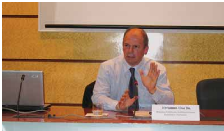
Euskararen erabilera sustatzeko asmoz laguntza ekonomikoak eskaintzen ditu Eusko Jaurlaritzak

Windows 2007 eta Vista euskaraz agertzeko asmoz, Mi-