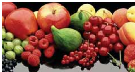
Fruta eta barazkiak beharrezkoak dira dieta osasuntsu batean

AZTI-Tecnaliak proiektuan izango duen zeregina konposatu bioaktiboak txertatuz, loditasuna kontrolatzeko haragiak diseinatzea izango da, produktu horien propietate fisiko-kimikoak eta sentzorialak mantenduz.