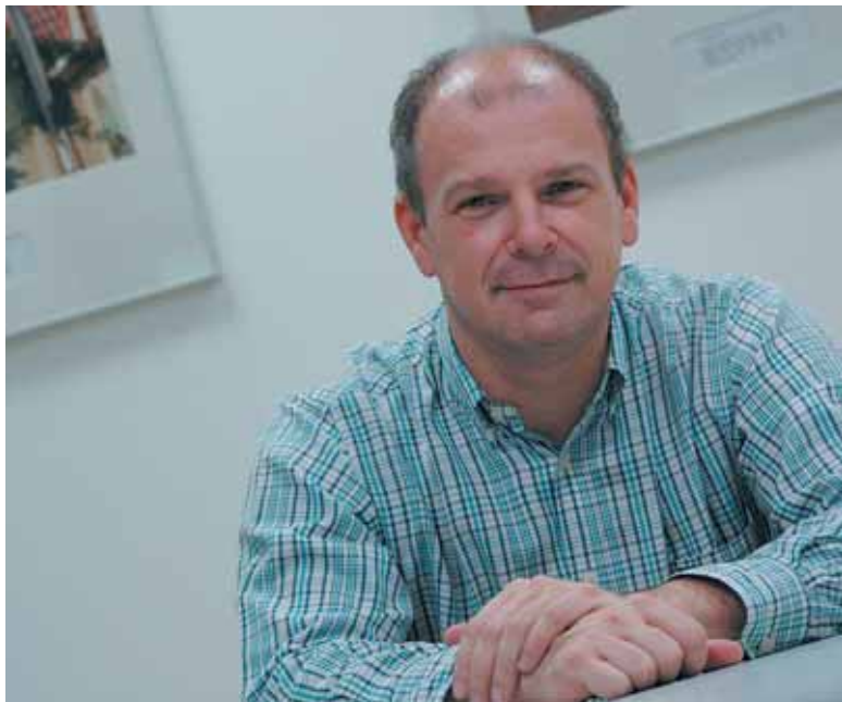
BIKAIN Ziurtagiria baino "saria" da Osarentzat

Ez dago munduan gizarte elebidunik maila berean, simetrikoki, bi hizkuntza erabiltzen dituenik. Gure artean, hitzunaren arabera, hitzun elebidunen kontzentrazioaren arabera, erabilera-eremuen arabera, eta abar euskara gehiago edo gutxiago, gaztelania gehiago edo gutxiago erabiliko da. Hori da normala. Etxean gaztelania etxeko hizkuntza duenak eta euskara bigarren hizkuntza gisa ikasi duenak jardun-eremu barrenkoi-intimoetarako are erosoago baliatuko du gaztelania seguruenik, euskara, aldiz, jardun-eremu formalagoetan baliatzeko are eskuragarriagoa gertatuko zaio, beharbada. Euskara etxeko hizkuntza duenaren kasuan alderantziz, oro har, gertatuko da. Era berean, hitzun bakoitzak bizitzan zehar dituen bizi-baldintzen arabera hizkuntzekiko erlazioa ere aldatuz eta egokituz joango da, gainera, dakienean indartuz edo ahulduz. Elebitasun erreala eta eragingarriari buruz jardutean, bi hizkuntzak baliatu ahal izateko gutxieneko ezagutza barn-eratu beharraz ari gara hemen, nire ustez. Euskaraz jarduten duenak euskaraz segitzeko aukera izateaz, aldamenekoa traba izan gabe, ingurukoak erabiltzeko zailtasunak eduki arren, ulertzeko zailtasunik ez duelako. Euskararen erabilera areagotzeko eta orokortzeko elebitasun pasiboa, gutxienez, ahalik lasterren hedatzea erabakigarria da.