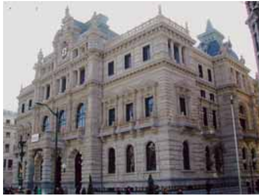
Bizkaia Foru Aldundiak aurrekontu murriztago izango du aurten

Datuen arabera, Euskadiko udalek 1.400 milioi euro gutxiago sartuko dituzte euren diru-kutxetan. Lurralde Historiko bakoitzak an-