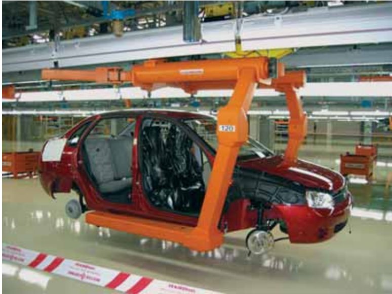
Kotxeen ekoizpenak behera egin du azken hilabeteetan

Ia 2.000 lagun kalean utziko dituen erregulazio honek ekoizpen txanda batera murriztuko du produkzioa, Nissaneko arduradunen arabera "jarduera egungo merkatuko eskarira egokitzeko" asmoare-