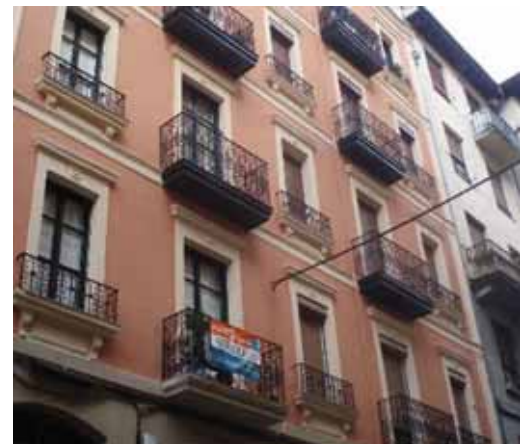
Iaz baino etxe gutxiago saltzen dira aurtun

Bigarren eskuko etxebizitzek %4,9ko beherakada izan dute aurtengo bigarren hiruhilekoan. Horrela, metro karratuko prezioa, urtariletik irailera arteko epealdian, %5,6 merkatu da.