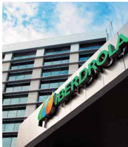
Iberdrolak iaz baino %53,8 gehiago irabazi du

tzako Agenda 21eko xedede betetzea eta iraunkortasunari buruzko txostenak eta analisiak prestatzea dira Institutu berriaren helburuak. Horrela, Bizkaiko Lurralde Historikoko ingurumena babesteko garapen politikaren jarraipena egiteko ardura izango du. Ateratako ondorioak eta lortutako ezagutzak, ondoren, udalen ingurumeneko gaien arduradunei helaraziko zaizkie. Bizkaiko iraunkortasunaren bidea jorratzeko erreminta izan nahi du zentroak.