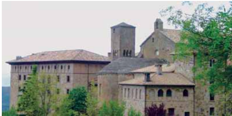
Leyre Monastegia, Kanpoko ikuspegi batetik

Asteburua Nafarroako Leyre Monastegian ematea da hileko Ekonomiaren Kazetaren proposamena. Iruñetik 50 kilometrora dago Leyreko Xalbador Deunaren Beneditarreko Abade-etxea,