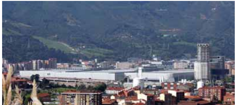
Barakaldoko BEC Azoka biltzeko gune garrantzitsu bihurtuko da

Azoka urtero antolatzen duen konpainiak, Turret Middle East delakoak, Euskadi aurreratu du 2009an erakusketaren egoitza izateko, "euskal herrialdeak energia garbiekiko erakutsi duen atxikimendua" dela eta. Gainera, Euskadik "petro-