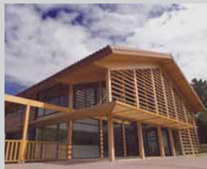
Innobasque Bizkaiko Parke Teknologikoan duen egoitza

Lehenik eta behin, nire aurrekoak martxan utzi dituen helburu guztiak betetzen saiatuko naiz eta bigarrenik, nire taldearekin bat eginez euskal gizarteari balio erantsia ematen ahaleginduko naiz, kanpora zabaltzeko plan baten bidez eta inguru horretan agian faktorerik garrantzitsuena euskal erakundeetatik eramaten diren nazioarteratzeko ekintza desberdinen sinkronizazioa izan daiteke.