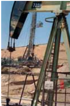
Petrolioaren prezioa %32 igo da

Abuztuarekin alderatuta, prezioa gora egin duten