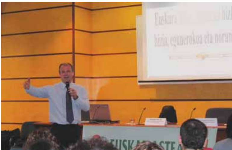
Osa, Euskal Asteko jardueretan

Ekimenak piztu duen interesarekin, orain arteko partaidetzarekin eta jaso ditugun ekarpenekin pozik gaudu, bene-benetan. Hizkuntza politikaz lasai eta askatasunez eztabaidatzea eskean ari zen jendea, aukera ema-