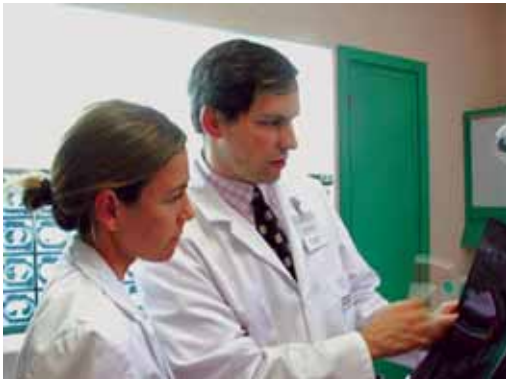
Minbizia garaiz detektatzean lan egiten du Gaikerrek

Gaikerreko zentro teknologikoak nanopartikulen erabilera garatzeko proiektua martxan jarri du, minbizia garaiz detektatzeko eta sen-