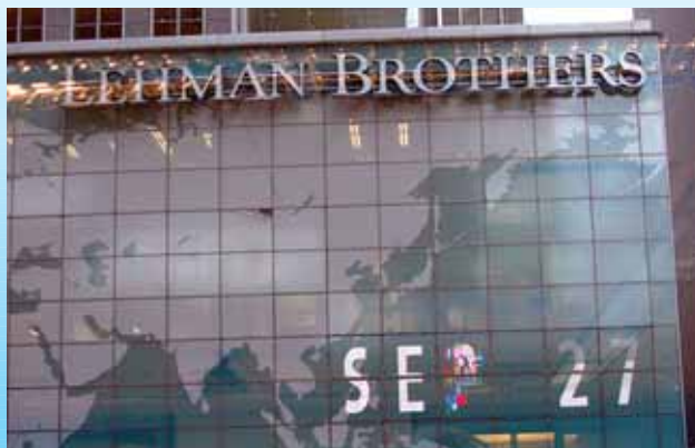
Lehman Brothers AEBtako azken porrot ezagunetarikoa izan da

Enpresa arrakastatsuen eta arazoak dituen enpresaren arteko desberdintasuna aurrekontuan datza. Ez aurrekontu handia izatean, baizik eta aurrekontu hori bera izatean. Adituek aurrekontuaren garrantzia azpimarratzen dute. Ondo egindakoa izan behar da eta, noski, eguneratua, eta aurrekontuarengan eragina izan dezakeen edozein erabaki ekonomiko