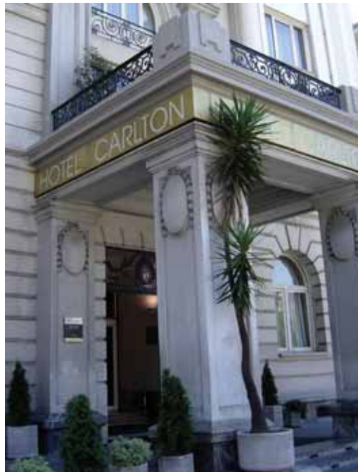
Euskadiko hotelek bidaiari gutxiago izan dituzte

Landa-turismoko hotelak izan dira datu baikor bakarra izan dutenak, Eustatek dituen datuen arabera. Horrela, turismo mota honetako bidaiarien sarrerak eta gaualdiak 6 puntu igo dira joan den urtearekin konparatuta. Araba izan da bidaiari izan dira hiru lurralde Handiena izan duena, %28rekin. Bidaiari horien %38 kanpotik etorritakoak izan dira.