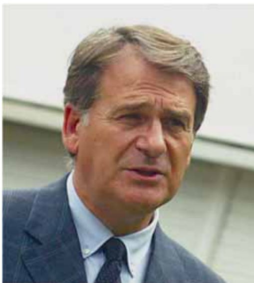
Maidaganek Innobasquen garatuko ditu bere lan berriak

Gure manufakturazio arloan, behintzat, badago adina personal kualifikatu Euskadin eta esan dezakegu gehien-ak ikerkuntza zientifikoko