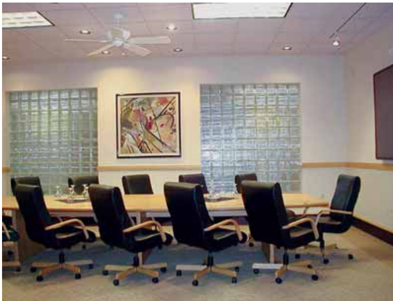
Irtenbideak bilatzeko guztien arteko biltzarrak egitea beharrezkoa da

Recacoecheak azken urtea hartzen du aldaketarepe