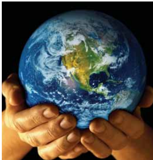
Ingurugiroaren etorkizuna guztion esku dago, baita enpresen esku ere