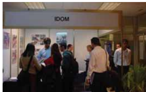
Idom ingenierritzak nazioarteko azoka aniztatan hartzen du parte

batera, nazioarteko enpresa honek eskaintza merkatuko baldintzetara egokitzeko asmoz, beste zenbait neurri jarriko ditu martxan. Gauzak horrela, Arcelorrek gastu orokorren erabateko murriztapenari ekingo dio, datozen bost urteetan 4.000 milioi euro aurreztu ahal izateko. Era berean, burdingintzako enpresak inbertsioak motelduko ditu, segurtasunari eta ingurumenarekin erlazionatutako inbertsioei lehentasuna emanez.