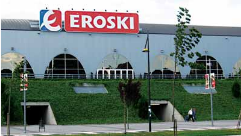
Eroski kooperatibak soldaten izozketak proposatu ditu datorren ekitaldirako

Krisialdiak ekarri duen eska-riaren jaitsierari aurre egiteko asmoz, MCC Arrasateko Korporazio Kooperatiboak taldeko enpresari gastu murrizketaren politika aplikatzeko aholkatu die. Egungo