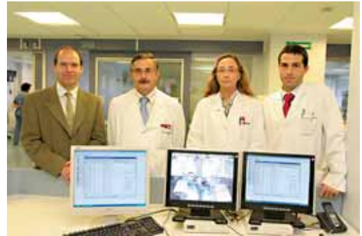
Sistema- informatiko berritzailea gaztu duen ikertzaile-taldea

"Thrombosis and Haemostasis" aldizkarian argitaratu du ikertzaile taldeak erreminta informatiko berri honek ekarri dituen emaitzak. Lan honetan parte hartu dute Nafarroako Unibertsitateko Hematologia, Dokumentazio, Kalitate, Neurobiologia eta Informatika Zerbitzuko doktoreek.