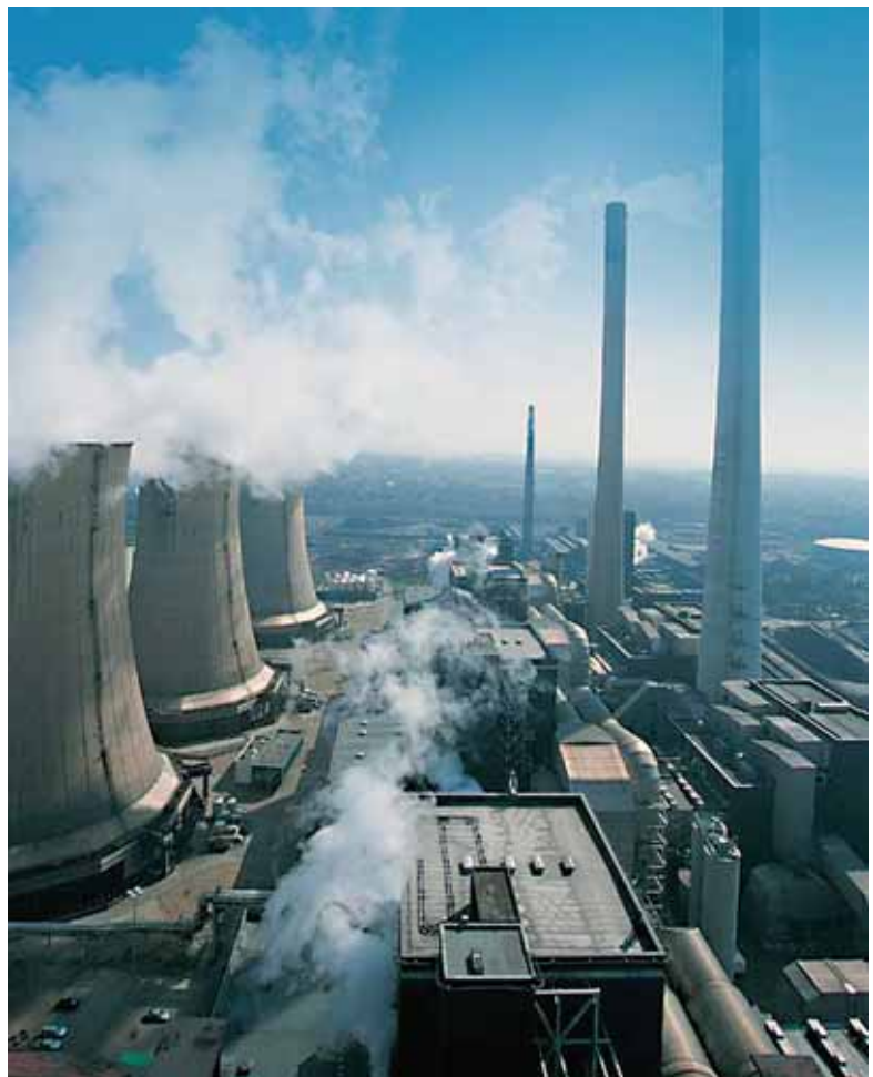
Bereziki kutsatzen duten enpresek Garapen Iraunkorrarekiko atxikimendua erakutsi behar dute

900 15 08 64 Orduetgia: 9-13 h / 15-17 h ihobeline@ihobe.net