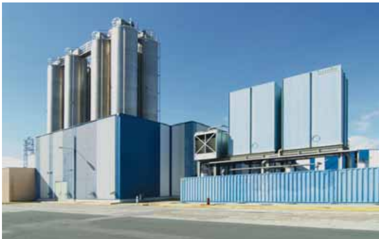
Euskal enpresek likideziaren beharra dute

BBK-k kaleratutako txostenaren arabera, enpresa txikiak dira egungo egoera ekonomikoan zailtasun handienak dituztenak, eta arduradunek maileguen partetik handiena eguneroko ordainketei aurre egiteko erabiliko