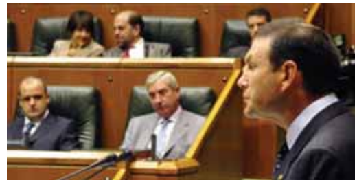
Eusko Jaurlaritzako planak 12.800 milioi euroko aurrekontua izango du

Donostiako Miramon Parke Teknologikoan azaroan izandako Planaren aurkezpenean, Euskadiko enpresari nagusien aurrean Ibarretxe Lehendakariak hitza hartu zuen eta garai zailtan enpresa eta erakunde arteko