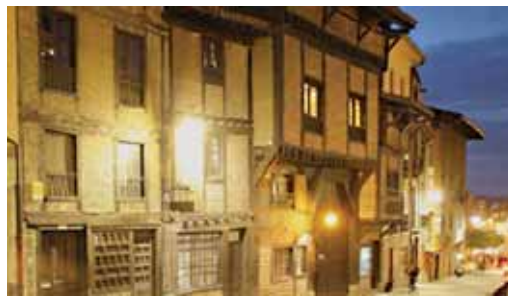
Jatetxeak Erdi Aroko giroa mantentzen du

Aintzineko posta-etxea, egun jatetxea dugu El Portalón. Gasteizko erdigunean kokatuta, Maria Deuna katedraletik hurbil dago. XV. mendean bidaiarien zaldiak eta gurdiak gordetzeko erabiltzen zen eta birmoldaketa ugari jaso baditu ere, erai-kinak Erdi-Aroko giroa eta izaera mantendu egin du.