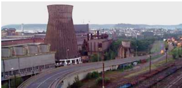
Arcelorrek ere krisia pairatzen du

Lantegi zahar ugari bota dituzte Zorrotzaurren. Idom ingenierritzak bezala, Euskadiko enpresa garrantzitsu askok Zorrotzaurre berrian beraien egoitza berriak jartzeko interesa erakutsi dute, BBK haien artean. Zaha Hadid arkitekto irakiarra izango da Zorrotzaurreko lurraldeko birmoldaketaren egilea. Etxebizitzek, tranbiak eta musika eskolak, besteak beste, osatuko dute Zorrotzaurreko irla berriua.