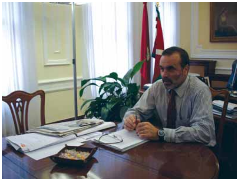
22 milioi euroko aurrekontua izango du datorren urtean Lana eta Trebakuntzarako sailak

Enplegu-erregulazioko espedienteak aurkeztu dituzte enpresa askok, azkena, Bridgestone. Espediente hauek xehetasunez behatzen al dituzue? Ez al da posiblea zenbait enpresek, krisiaren aitzakipean, laguneren kaleraketa