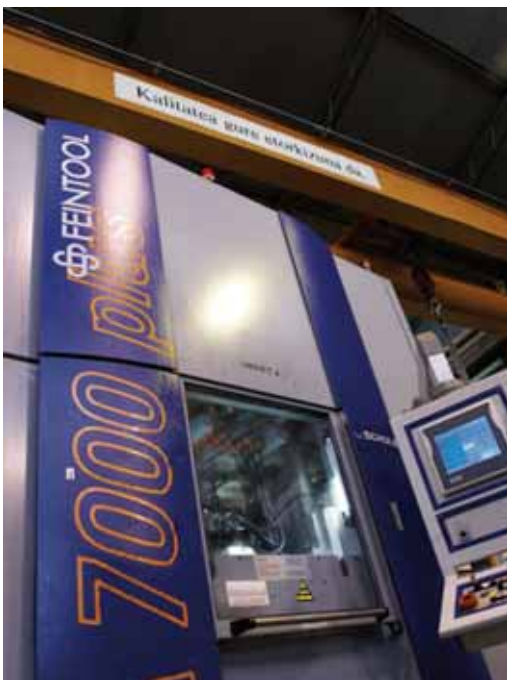
Haien gailu eta makineria euskaraz erabiliak izaten dira

Ofiziala, publikoa eta doakoa den Bikain Ziurtagiriak hiru maila eta kolore ditu, enpresa edota erakunde jakin batek lortu dituen puntuen arabera. 200-399 puntu bitarteko enpresentzat, Ziurtagiria beltza izango da eta euskararen oinarritzko maila egiaztatuko du. Tarteko maila zilar kolorekoa da eta 400-699 puntu bitartean lortzen duten enpresei egokituko zaie. Urrezko kolorea goi mailako euskara frogatzen duten enpresa nahiz erakundeentzat izango da, 700-1.000 puntu bitartekoentzat, alegia. Eusko Jauriaritzak euskararen presentzia, erabilera eta kudeaketa egiaztatzen duten enpresa edota erakundeei ematen dien ziurtagiria dugu Bikain Ziurtagiria.