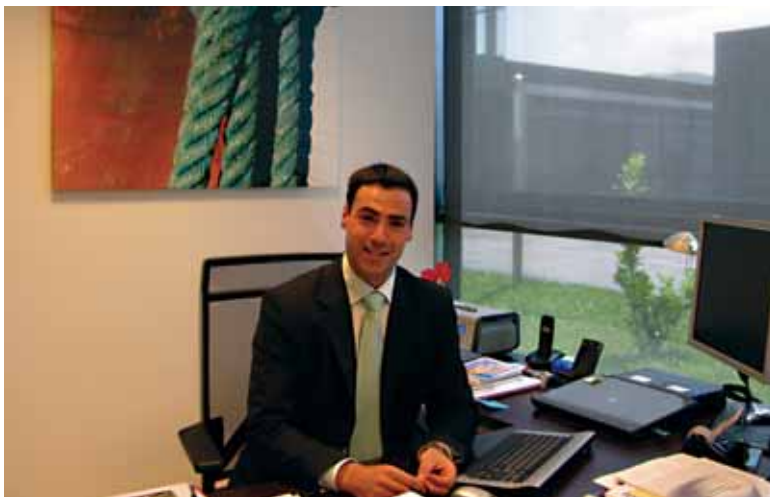
Bizkaia:xedeak Zamudioko Parke Teknologikoan du egoitza

Bizkaia:xede 3TE Proiektuko kidea da. ETEi bereziki zuzenduta, "Teknologia Transferentziarako Talentua" haien enpresetan garatzen laguntzen du. Nola prestatzen dira enpresa hauek euskal garapenera trenatu ez dezaten?