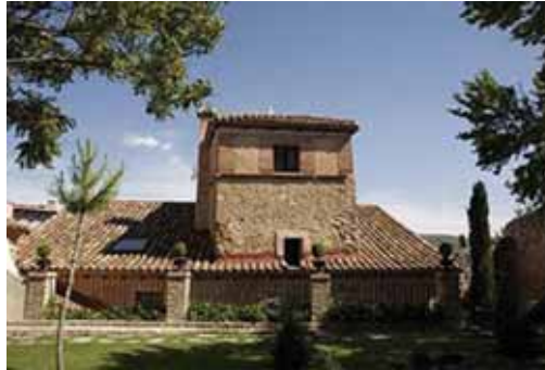
Hotelaren eraikina XVIII. mendekoa da

Hotela Guadalajarako Imon herrixkan kokatua dago. Herrialdeak 40 biztanle inguru ditu eta asteburuko turismoa egiteko oso aproposa da, txikia bada ere, bisitatzeko puntu garrantzitsuak baititu, erromatar garaiko gatzako meatzeak, adibidez. Bi egun diferente eta lasaia igartzeko kontuan hartzeko merezi duen aukera.