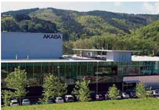
Arrasateko zuzokideek duela bi urte olio birziklitzeko sistema hura dutela eskura

Gaur egun, enpresa gipuzkoarrak hiru arlotan ditu bereziki haren bezero laginak. Batetik, ospitalak, unibertsitateak, hotelak eta biltzar jauregiak bezalako elkar-tetik. Bestetik, autobusa, metro eta tren bezalako bidaiari-entzako geltokiak. Eta azkenik, enpresa munduko bulegoak izaten omen dira gehienbat Akabaren bezeroak. Gipuzkoako enpresak sari anitz jaso ditu urte hauetan, haien artean, Enpresa Bikaintasunaren Principe Felipe Saria azpimarratu dezakegu.