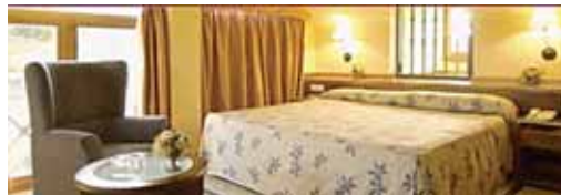
Ciudad de Cenicero hotelaren logela

Informazioa eta erreserbak: 941 446 766 telefonoz Ciudad de Cenicero Hotela / Majadilla z/g / 26350-Cenicero (Errioxa) / Telf 941 454 888