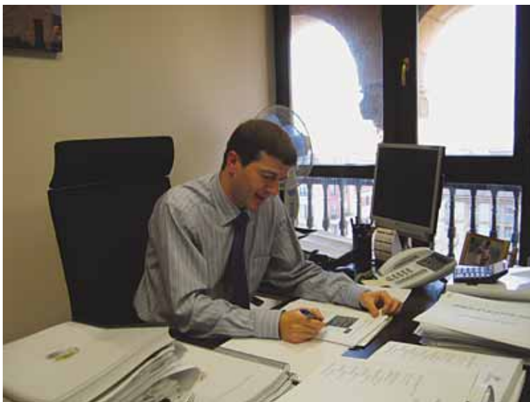
Soloetaren ustez, komertzioek "aspalditik" bizi dute egoera makalean

Halaxe da. Krisialdi momentuetan eskaria geldiarazi egiten da, eta horrek eragin zuzena izaten du beraien-gan, eurak izaten baitira nabaritzen duten lehenetari-koak. Bizi ditugun momentuak zailak badira ere, nire ustez, komertzioek aspalditik bizi zuten egoera berezia. Kontsumitzaileen oihuteren