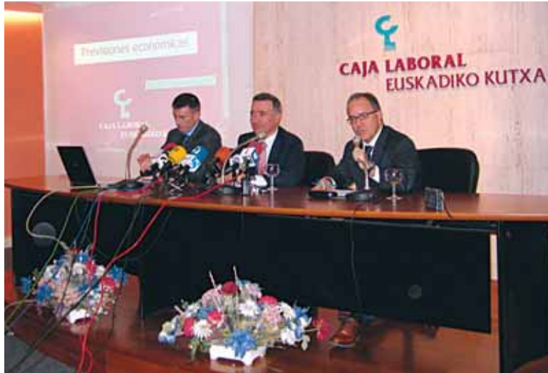
Euskadiko Kutxaren analisien arabera, Euskadik %0,6ko BPG izango du aurten