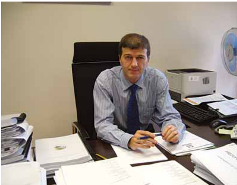
Getxoko ekonomia arduraduna Udalean duen bulegoan

Udalerriko proiektu nagusia dela uste dut. Lehenengo berriak izatean, Getxora ekartzea oso garrantzitsua iruditu zitzaigun, teknologia berriekin eta berrikuntzarekin erlazionatutako alorretan gure udalerriak zeresan handia izan dezakeelako uste baitugu. Zenbait jardura alorretan potentzial handia dugula uste dugu, eta oso pozik gaude horrekin. Ekimen honek nazioarteko teknologia berrien mapan jarriko du Getxo, eta jendea erakarriko du. BizcayTIK programaren garapenarekin batera, Areetako Hiri Elkartegia martxan jarriko dugu, egitasmo eta sektore ekonomiko honi lotutako enpresa berrientzako sarea izango dena. Horrek ahalbidetuko du,