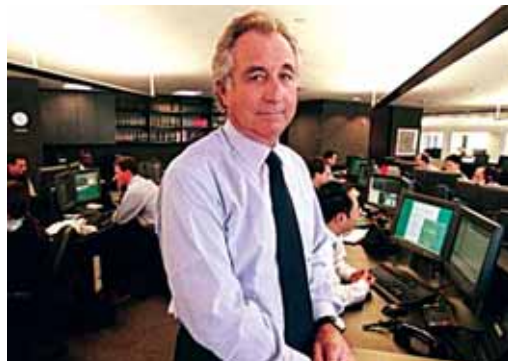
Madoffek 50.000 milioi euroko iruzurra egin zuen

tearen "garapen baikorra" agerian uzten duena.