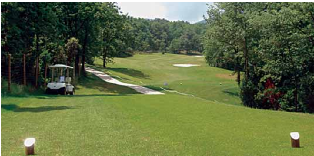
Aymerich Golf Clubeko golf zelaia

ez duzu egin behar. Golf zelaietan zulo batzuk besterik egin nahi ez baduzu, Aymerich Golf Clubarekin kontaktuan jarri, zure nahietara egokitutako planak baitituzte.