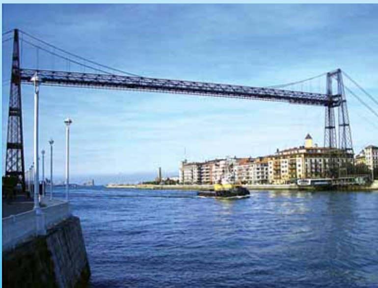
Bizkaiko Zubi Esekia Euskal Historia-Ondarea da

Orain dela gutxi arte, hori gure herriko errealitatea izan da. Kasu batean izan ezik, gurutzontzi guztiek geldialdiak besterik ez dituzte egin Getxon. Itsasontzi hauek datozen turistak oso denbora murriztua dute; hori dela eta, normalean, alde zuzenetik kontrataturiko txangoen bidez, autobusetan sartzen dituzte eta Bilbora eraman, Getxo oraindik ez delako ezaguna. Turisten ihesaldi hori egotea erabat logikoa iruditzen zait, baina lanean ari gara turista horiek Getxo ezagutzeko aukera izan dezaten. Horrekin batera, turistak daramatzaten autobusek Getxon geltokia izatea lortu egin dugu, behintzat, haiei herria ezagutzeko aukera eskainiz. 2008an, 2007ko gurutzaldi kopurua bikoiztu zen, eta horiek kontuan hartzeko datuak dira. Hori dela eta, turista hauei eusteko, norabide horretan lanean dihardugu.