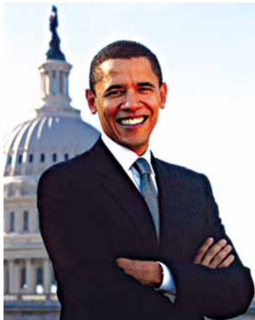
Urtarrilaren 20tik aurrera Etxe Zuriak jabe berria izango du

AEBtako krisialdia atzeraldi ekonomiko bihurtzeko arriskuan dago eta hura ekiditzeko, hainbat neurri zorrotzak jarri behar izango ditu Obamaren lantaldeak. Horrela, presidente berriak suspertuta planari eusten dio. AEBtako Kongresukideak pizgarri ekonomikorako 700.000 milioi dolarreko estrategia prestatzen aritu dira. Plan honek inbertsioak azpiegituratan enpleguaren sustape-