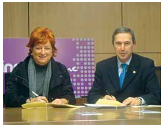
Villate eta Elempuru, akordioaren sinarmenean

AEDk emakumeen garapen profesionalari laguntzen die, enpresak sortzeko azpiegiturazko laguntza eta finantziarioa lortzeko babes ekonomikoa eskainiz. Elkarteak lankidetzahitzarmenak ditu erakunde publiko nahiz finantzia-erakunde anitzekin. Era aktibo batean parte hartzen du Europar Gizarte Foroaren EQUAL egitasmoaren bidez prestatzen diren europar proiektuetan.