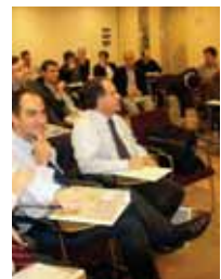
PMP®: enpresaburu zuzenentzako ziurtagiria