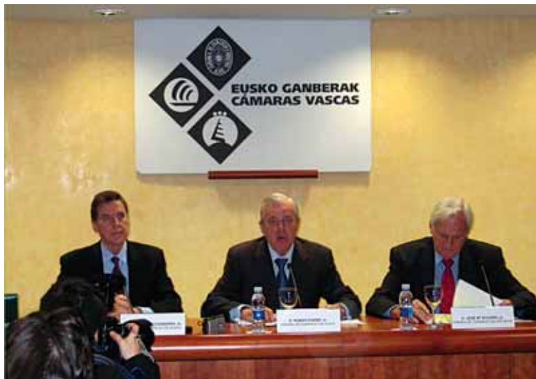
Eusko Ganberako presidentek Bilbon emandako prentsaurrekoan

Datorren ekitaldiak ez du hazkunderik ekarriko; Echarriren hitzetan, "egoera ia laua izango omen da". Euskadiko Kutzako arduradunek bezala, Euskadiko Ganberetako buruek ere ez dute Euskadirako atzeraldi ekonomikorik aurreikusten.