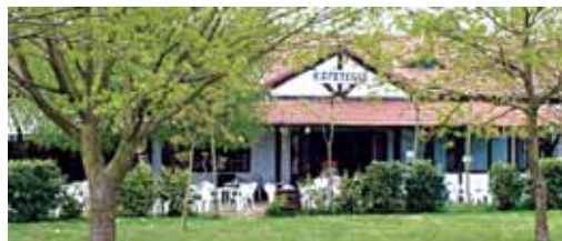
Haritz ingurututako jatetxea dugu Loiukoa

Euskadiko sukaldaritza tradizionala eta aisialdirako guneak uztartzen ditu Loiuko Sagardotegiak. Platerrak finkatuta dituen menuez aparte, buffet erako jate-txeaz gozatzeko aukera eskaintzen du jatetxeak. Izan ere, bi jantoki mota daude: sagardotegiko janari tradi-