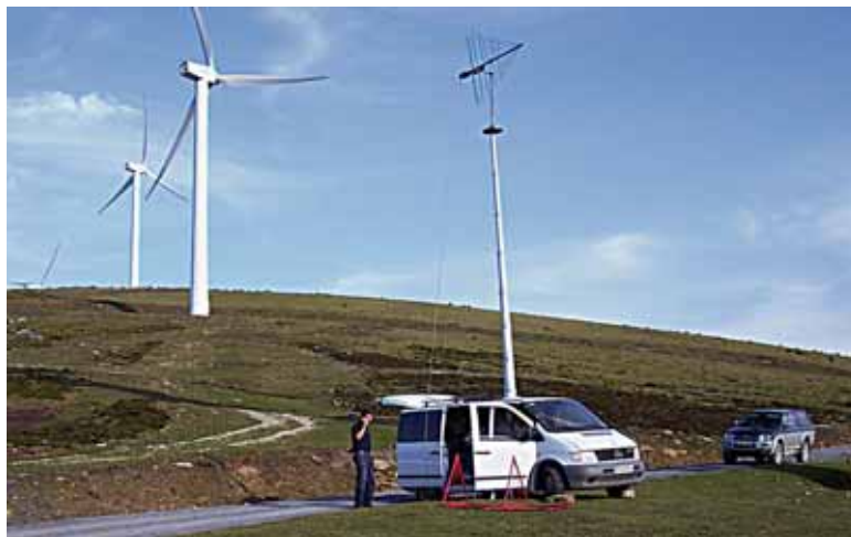
Oiz mendian unitate mugikorrarekin lan egiten