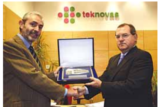
Suarezek Ajuriagoegaskoari harrera ematen

Euskadiko enpresei finantziario irtenbideak eskaintzen dizkien Elkarrekiko Garantia Elkarteak du ELKARGI. 1980ean sortuta, ETEi bereziki zuzenduta dago. Izan ere bere bazkide diren enpresen %90a 50 langile baino gutxiagoko enpresak dira. Bazkideen alor ekonomikoek dagokien, industriak %39a ordezkatzen du, merkataritzak %24a eta zerbitzu-sektoreak %17a. 10.000 enpresa bazkide baino gehiagoko kopurua 2005-2008 Plan Estrategikoan finkatutako helburuak betetzera datoz, arduradunen aburuz, elkar-