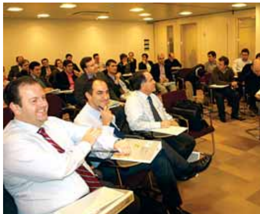
Ziurtagiria lortzeko, Innobasquek antolatutako ikastaroa egin behar da