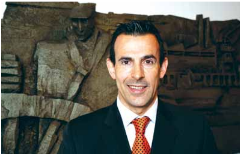
“Enpresa gehienek badute krisialdia gainditzeko koltxoi modukoa”

Krisia Euskadira beranduago heldu da, eta emaitzak oraindik ez dira erabat ikusi. 2009ko hasiera gogorra izango da. Automobilgintzarekin erlazionaturako enpresek bereziki momentu txarrak bizi izango dituzte. Hala ere, Euskadin industriak duen indarra dela-eta, krisialdia ez da hain larria izan. Estatuko beste Autonomia Erkidegoekin konparatuta, Euskadin hobeto gaudela uste dut. 2008. urtean zehar eta aurreko urteetan ere berrikuntzaren inguruan lanean ibili gara, krisialdiari aurre egiteko. Indartsua-