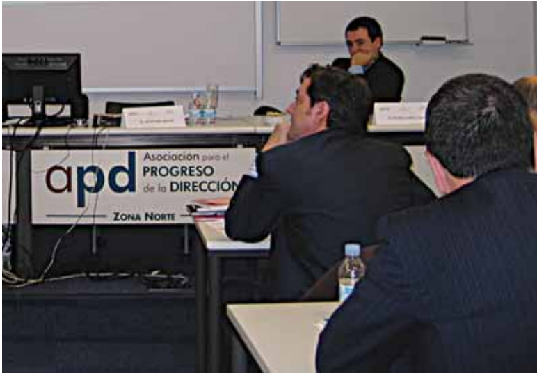
APDK Bilbon duen egoitzan izan zen abenduan antolatutako mintegia