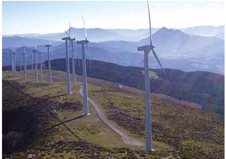
Oiz mendian Eólicas de Euskadik jarrirako haize-sorgailuak

Zer dela eta enpresa batek jotzen du Unibertsitatearengana? Arrazoiak anitzak dira. Batetik, "interesatua ez den norbaiten eske daudelako", azaltzen digu Davidek, "hots, emaitzak alde batekoak ala besteak izatean inolako interesik ez duen erakunde independententea behar dutelako". Izan ere, Unibertsitateen zerbitzuak eskatzen dira, oro har, emaitza objektiboak behar direnean. Bigarren arrazoiak "proiektu horrek ikerkuntza den atal bat duenean" izaten omen da, Daviden hitzetan,